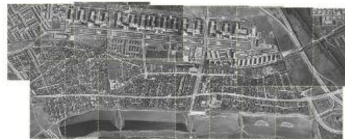
FlyfotoArkivet i GIS