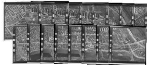
Scannede fotos i GIS

FlyfotoArkivet beregner den optimale rækkefølge af dine fotos og sørger for altid at vise det mest relevante billede "øverst". Dermed gør FlyfotoArkivet det til en fordel, at de skannede billeder overlapper hinanden. Vi klipper dine sorte kanter af on-the-fly, så du får en brugervenlig sammenhængende pseudo-mosaik.